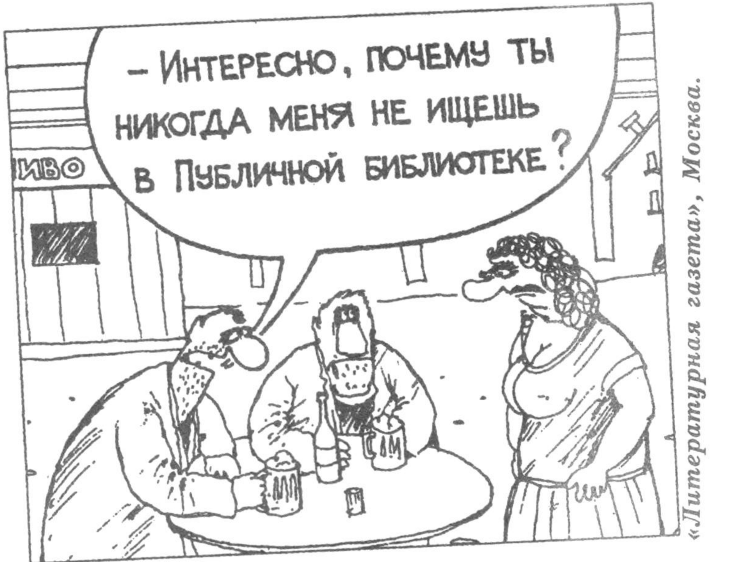
«Литературная газета», Москва.